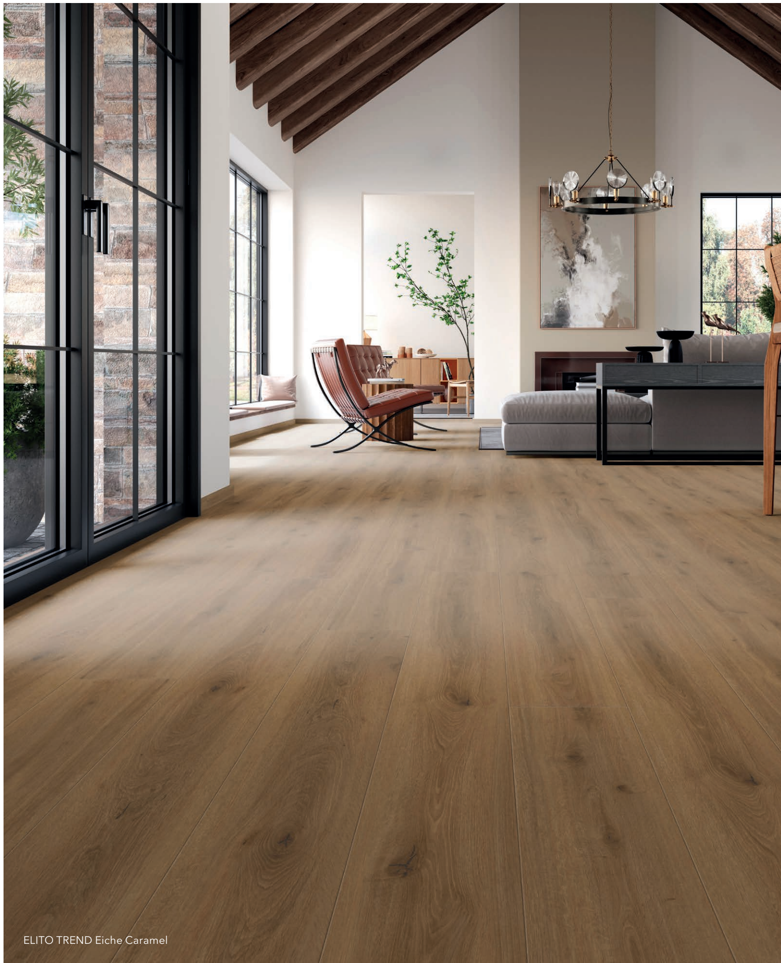
ELITO TREND Eiche Caramel