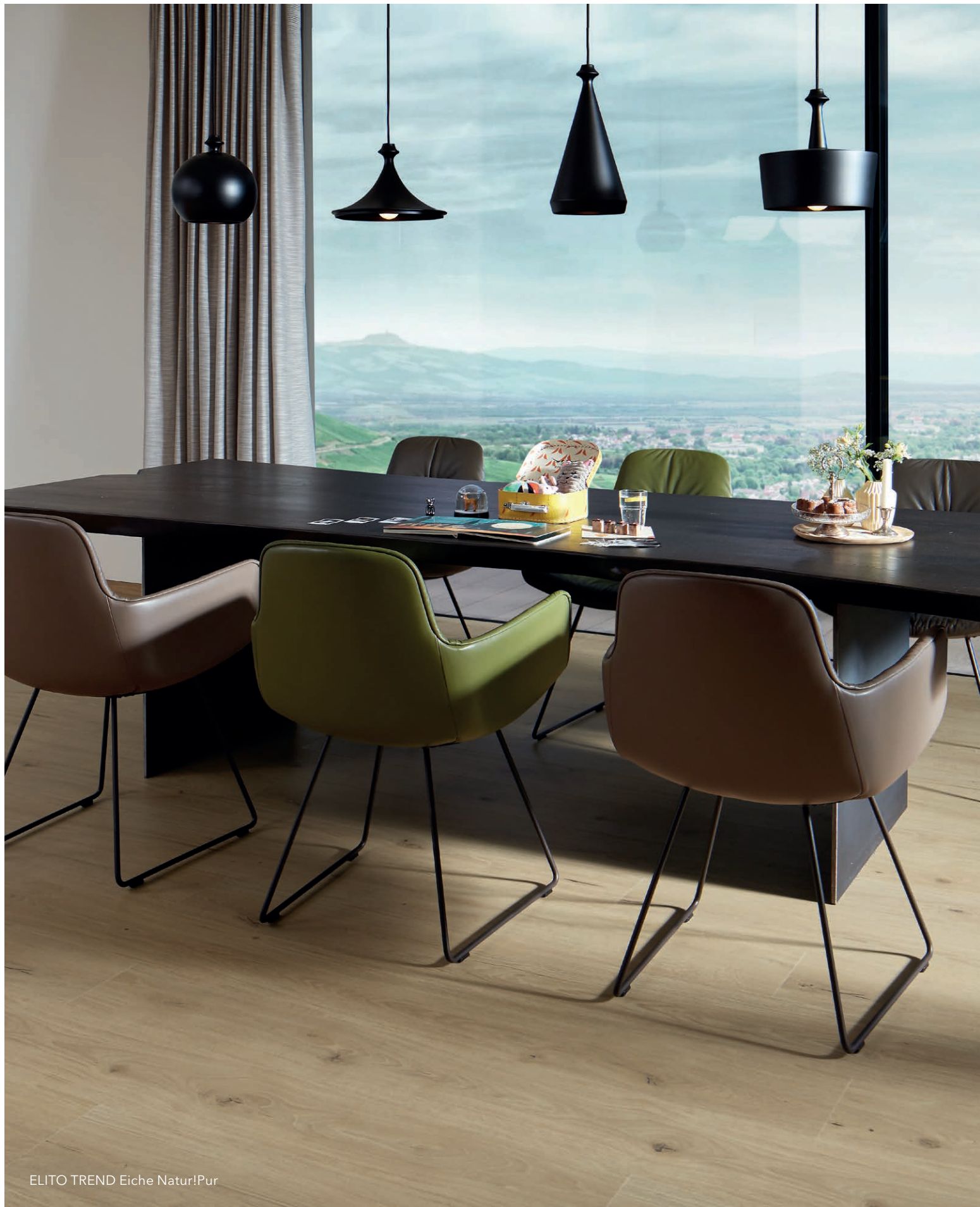
ELITO TREND Eiche Natur!Pur