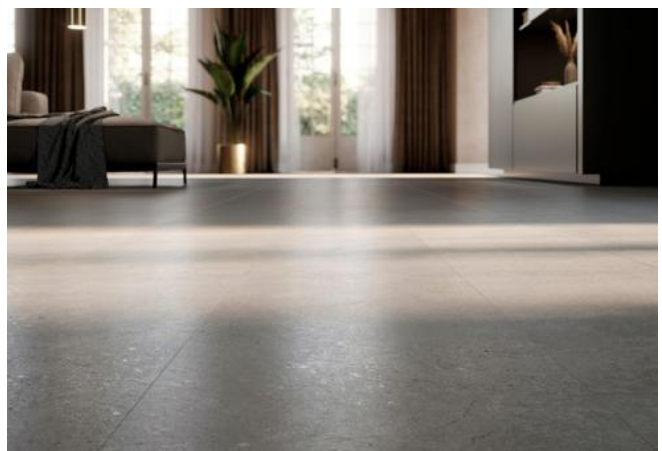
HDF Vinyl ELEGANTO Stein Graphit