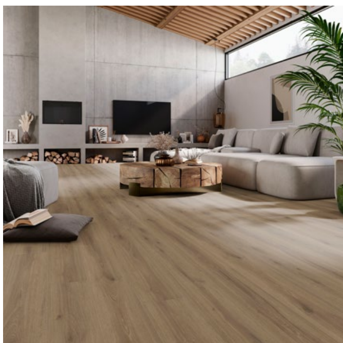
ELITO TREND Eiche Cafe!Pur