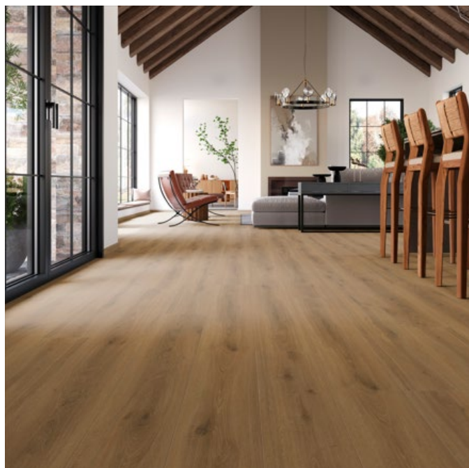
ELITO TREND Eiche Caramel