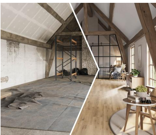
Rigid Vinyl wird zum Wohlfühlboden. Produkt: NOVO SPA Eiche Sand