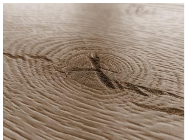
Prägedetail softsynchron Produkt: NOVO SPA Eiche Victoria